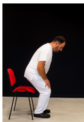
2. S'abaisse sur la chaise