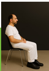
1. Positionne ses pieds